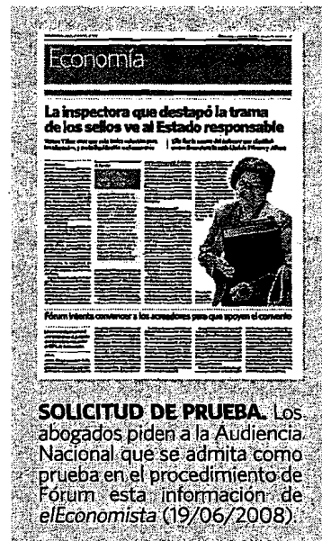
SOLICITUD DE PRUEBA. Los abogados piden a la Audiencia Nacional que se admita como prueba en el procedimiento de Fórum esta información de eEconomista (19/06/2008).