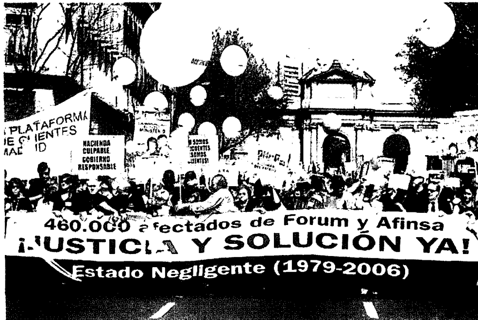
Adicae prepara movilizaciones de afectados para el próximo otoño con la intención de presionar al Gobierno a encontrar una solución política a los miles de clientes. LGN

¿Qué es lo que está en juego? Los escritos de conclusiones a los que ha tenido acceso LA GACETA no fijan un importe. "La cuantía sólo se puede ejecutar en sentencia, porque sería la diferencia entre el valor de los activos —de Fórum y Afinsa— y la cantidad invertida", explica Doñaque. El ahorro en Fórum ascendía a 3.702 millones de euros y en Afinsa