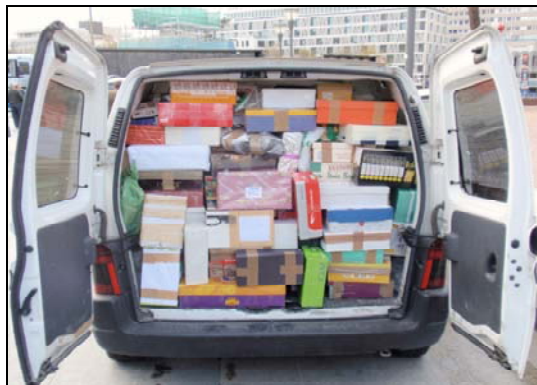
Tres furgonetas repletas se llevó la ONG.

El resultado fue magnífico. En menos de una hora se cubrió la previsión de donaciones. Nuestro reconocimiento a todas las personas que se ofrecieron a donar.