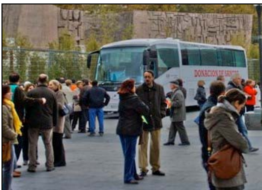
La unidad de donación se llenó en una hora.

Cuando les dijimos que nuestra intención, a través de la donación de sangre, era simbolizar el verdadero espíritu de los perjudicados de Fórum y Afinsa, que dan lo que a ellos les queda después de haberles quitado todo y entregan lo que a ellos nadie les ha concedido: SOLIDARIDAD, AYUDA, PROTECCIÓN Y VIDA , inmediatamente se pusieron a nuestra disposición e hicieron lo imposible por liberar una de sus unidades móviles y tenerla en Colón.